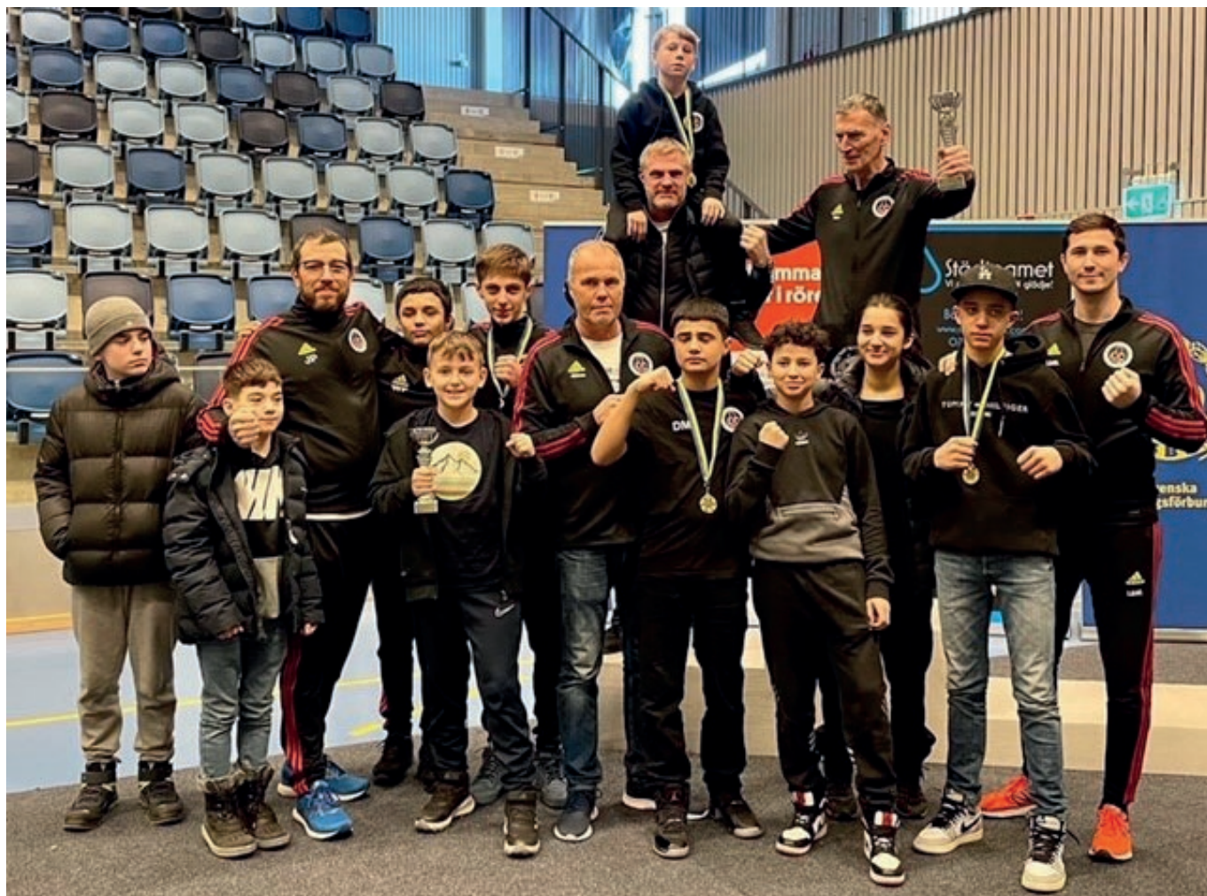
Bästa klubb Haninge BK.