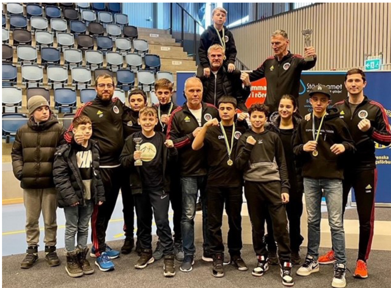
Bästa klubb Haninge BK.