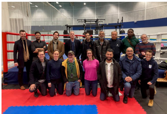
Läkarkonferens på Bosön

Läkarkommittén har under 2022 genomfört kurs för boxningsläkare på Bosön där nya läkare från landets alla hörn deltagit. Vi hoppas att klubbarna tar kontakt med någon som finns i närheten för hjälp med startböcker, eventuella skador och vid tävlingar. Vi har också fått föreläsa vid tränarkurs på Bosön och hoppas att detta ska upprepas regelbundet. Hör av er för hjälp vid boxningsskador, om ni har svårt att hitta tävlings läkare.